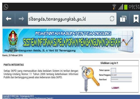
Gambar 2.4 Sistem Informasi Pelaporan Pembangunan Daerah

Melalui aplikasi ini pelaksanaan terhadap semua kegiatan dapat dipantau secara realtime oleh masing-masing Bidang. Setiap Bidang wajib melaporkan setiap bulannya dengan menginput pelaksanaan kegiatan fisik maupun keuangan.