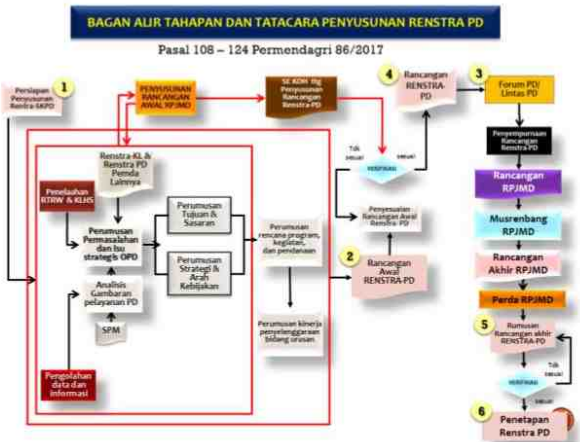
Gambar 1.1 Proses penyusunan Renstra Perangkat Daerah

Proses penyusunan Renstra Perangkat Daerah dilakukan dalam beberapa tahap sebagai berikut: