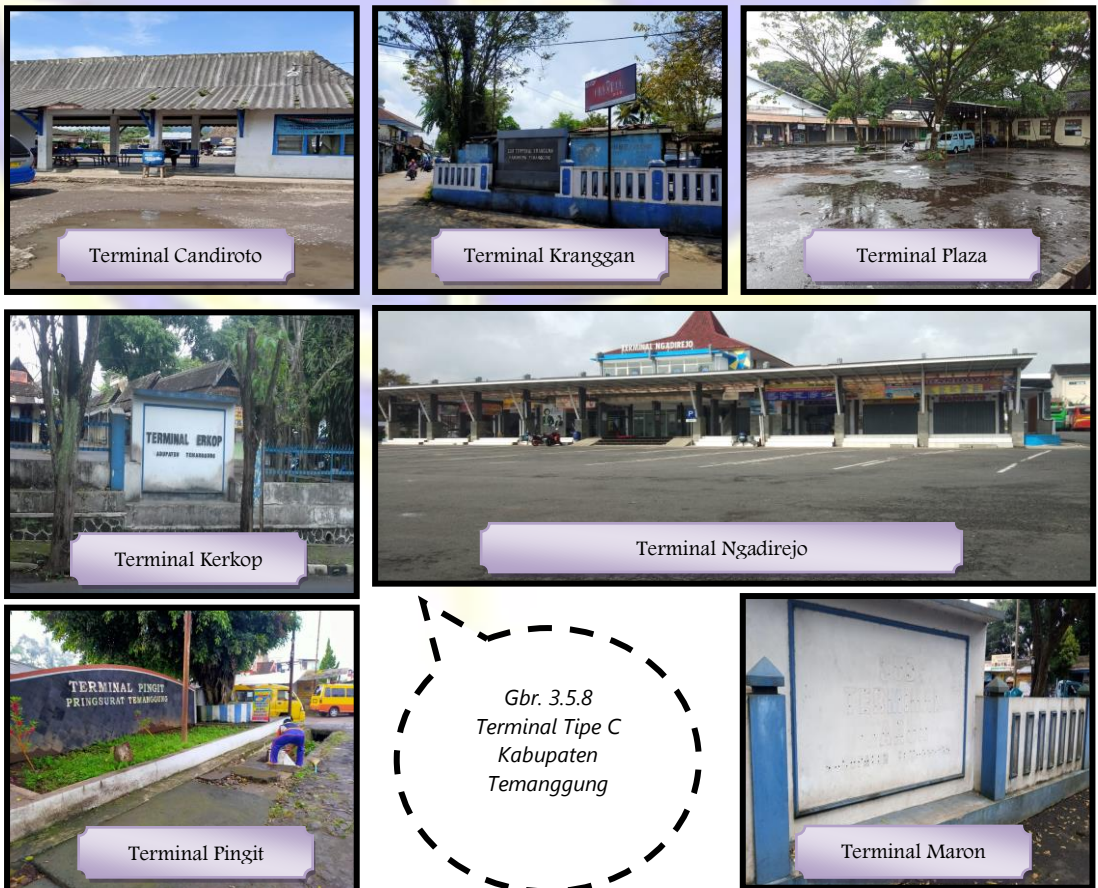
Gbr. 3.5.8 Terminal Tipe C Kabupaten Temanggung