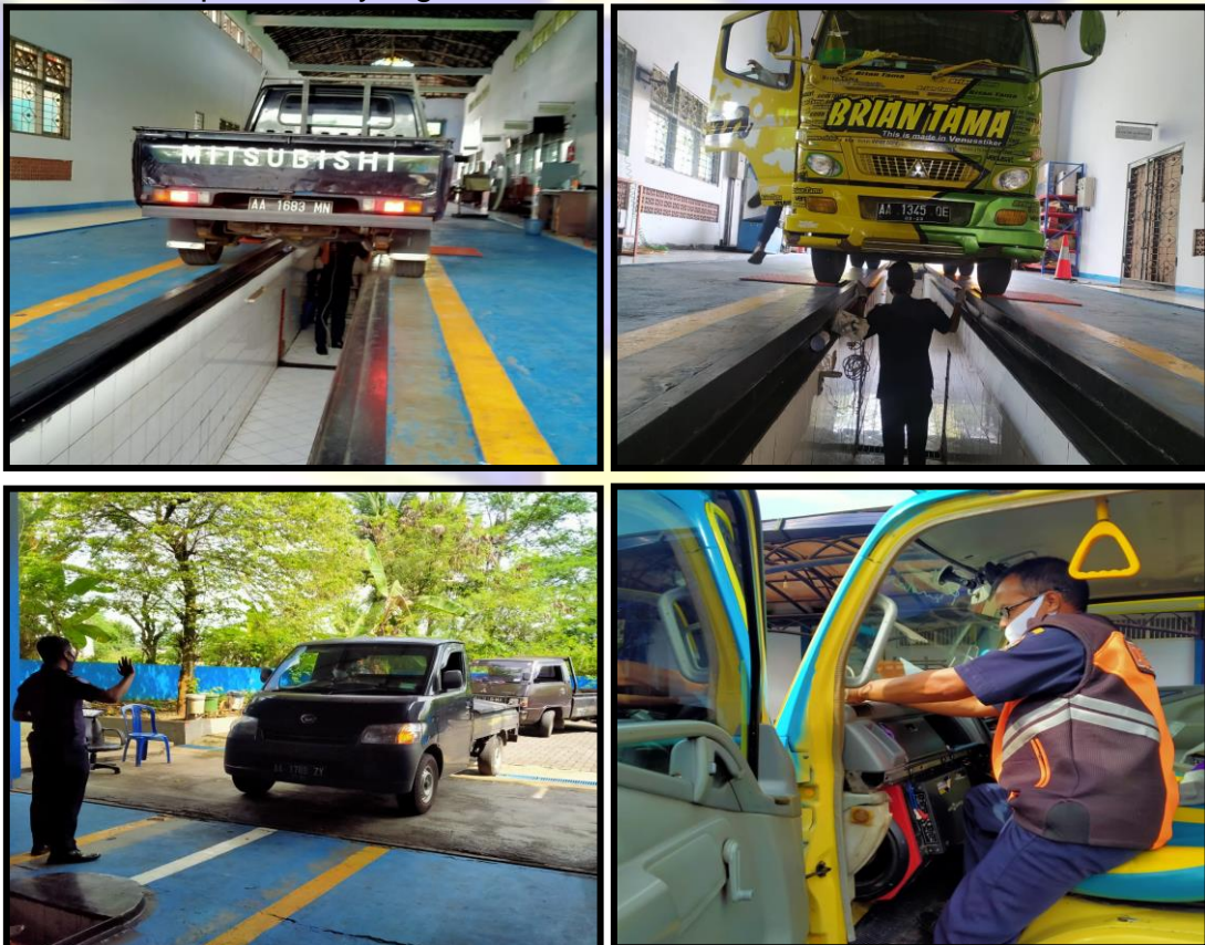
Gbr. 3.5.3 Pengujian kendaraan bermotor

Faktor Penghambat : Untuk menjadi bengkel umum kelas 3 yang memenuhi standar dibutuhkan upaya untuk meningkatkan kualitas baik disisi sarana, prasarana maupun SDM yang memadai.