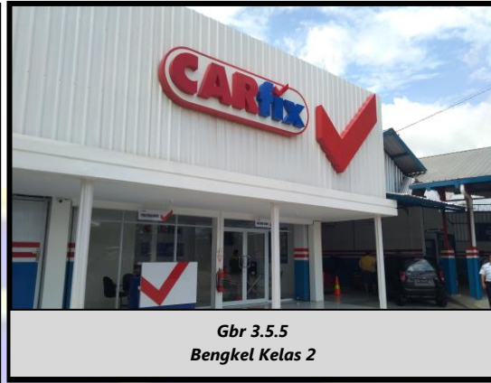
Gbr 3.5.5 Bengkel Kelas 2