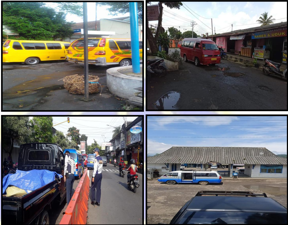
Gbr. 3.5.7 Angkutan umum di Kabupaten Temanggung