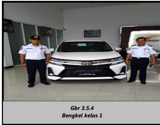
Gbr 3.5.4 Bengkel kelas 1