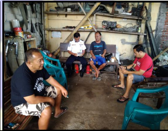
Gbr. 3.5.6 Bengkel kelas 3