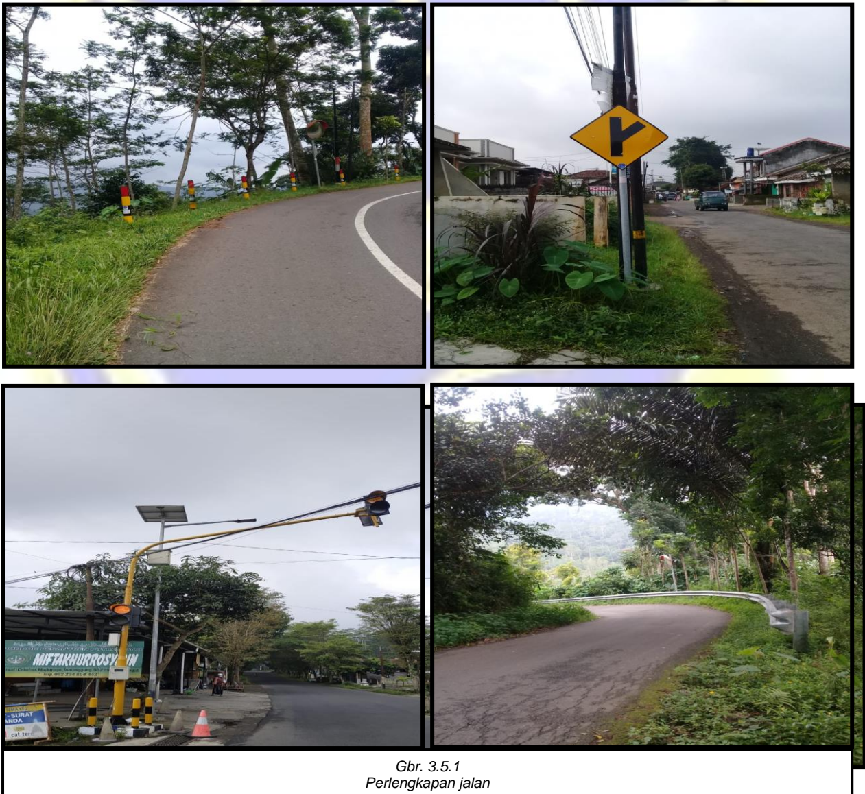
Gbr. 3.5.1 Perlengkapan jalan

Faktor Penghambat : Manajemen Pengelolaan perparkiran belum efektif karena dalam rangka mencapai target Pendapatan Asli Daerah melalui sektor perparkiran.